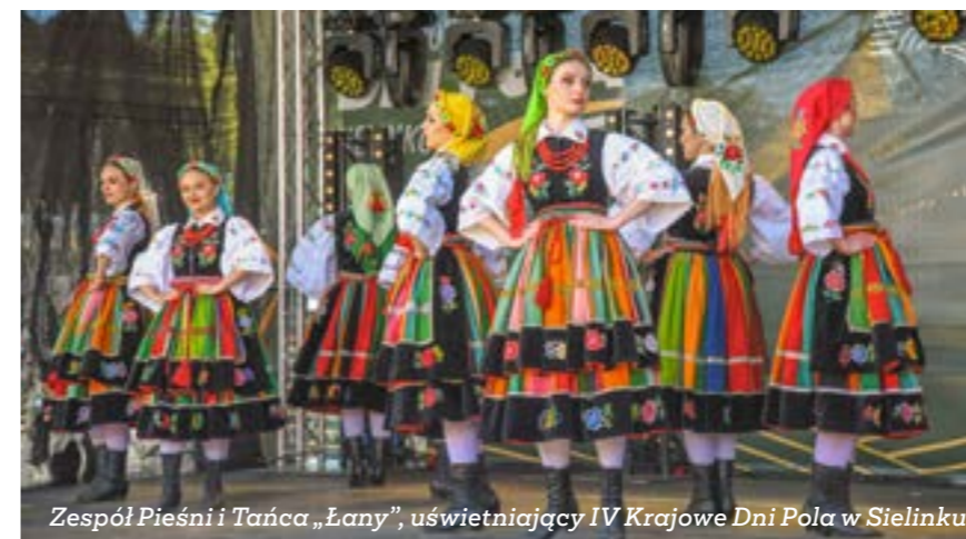
Zespół Pieśni i Tańca „Łany”, uświetniający IV Krajowe Dni Pola w Sielinku

Wielkopolski Ośrodek Doradztwa Rolniczego w Poznaniu rozpoczął ostatni, trzeci etap bezpłatnych szkoleń pod nazwą „Obowiązki rolnika w świetle ustawy Prawo wodne” na terenie województwa wielkopolskiego. Celem operacji jest odtwarzanie, ochrona i wzbogacanie ekosystemów powiązanych z rolnictwem