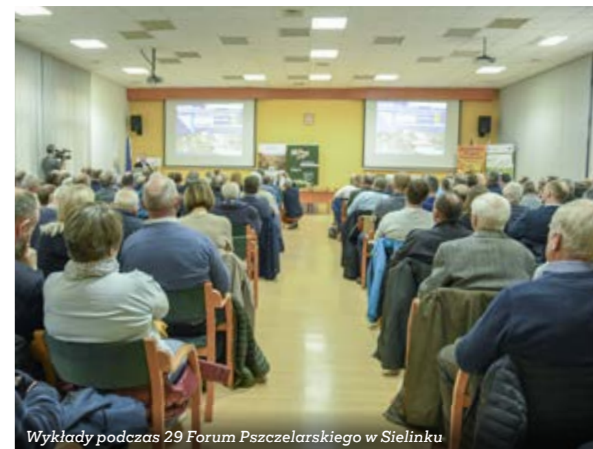
Wykłady podczas 29 Forum Pszczelarskiego w Sielinku

WODR zaprezentował harmonogram obsługi rolników przez pracowników w zakresie sporządzania wniosków o płatności bezpośrednie w 2023 roku.