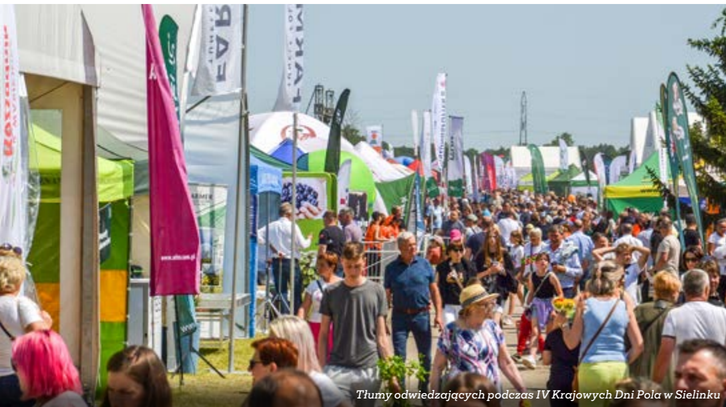
Tłumy odwiedzających podczas IV Krajowych Dni Pola w Sielinku

„Święta godne, lecz nie głodne!” Wielkopolski Ośrodek Doradztwa Rolniczego włącza się do akcji przedświątecznej zbiórki żywności organizowanej przez Wielkopolski Bank Żywności w Poznaniu, Pile i Koninie. Specjalnie przygotowane i oznaczone pojemniki na żywność zostały wystawione w sekretariacie biura w Poznaniu przy ulicy Sieradzkiej 29. ■