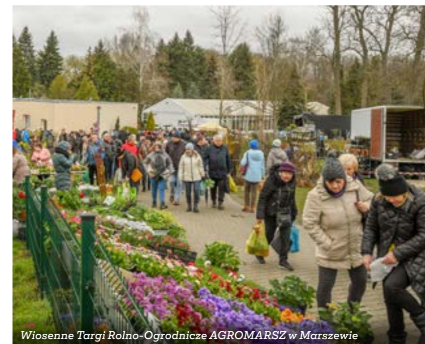
Wiosenne Targi Rolno-Ogrodnicze AGROMARSZ w Marszewie

Dwudniowe Dni Pola Gołaszyn – Wiosna 2023, czyli: wykłady dotyczące produkcji roślinnej połączone z pokazami na polach, skierowane zarówno do rolników, jak i uczniów szkół średnich. Organizacja WODR.