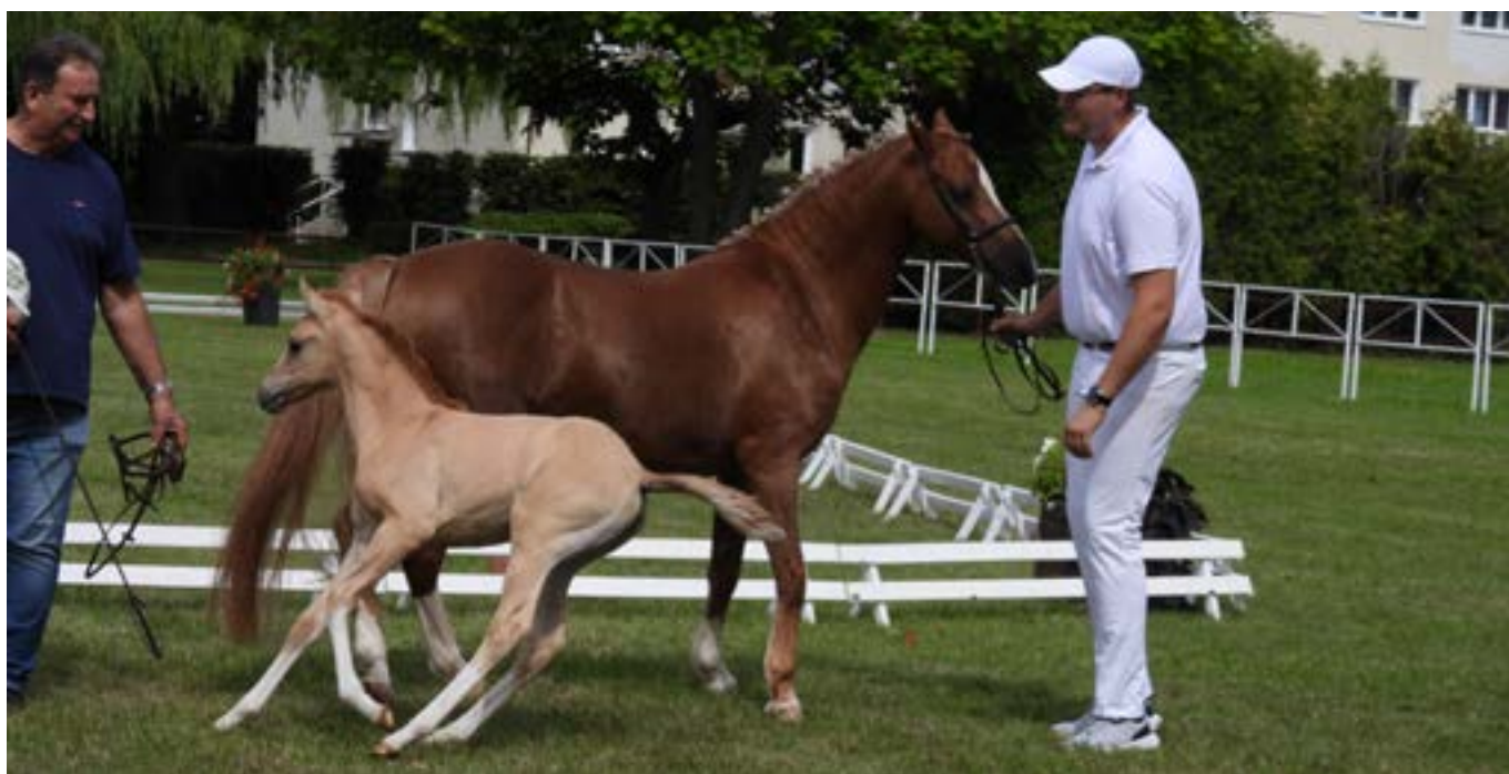
Konie: rasa kuce

Maria Biernacka Dział Technologii Produkcji Rolniczej