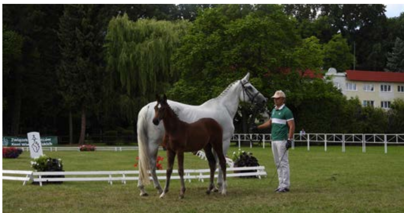
Konie: rasa wielkopolska

Premiowanie źrebiąt to początkowy etap selekcji w hodowli koni. Zanim obiecujące klaczki i ogierki dorosną może się wydarzyć wiele czynników wpływających na ich rozwój i kondycję, jednak wybierając źrebięta po najlepszych rodzicach mamy pewność wyboru dobrych i sprawdzonych genów koni rasowych. Najwyżej oceniane źrebięta są najbardziej pożądane. Po przeprowadzonej ocenie hodowcy mają ułatwiony wybór czy sprzedać źrebięta czy zostawić je u siebie, aby udoskonalać swoje stado.