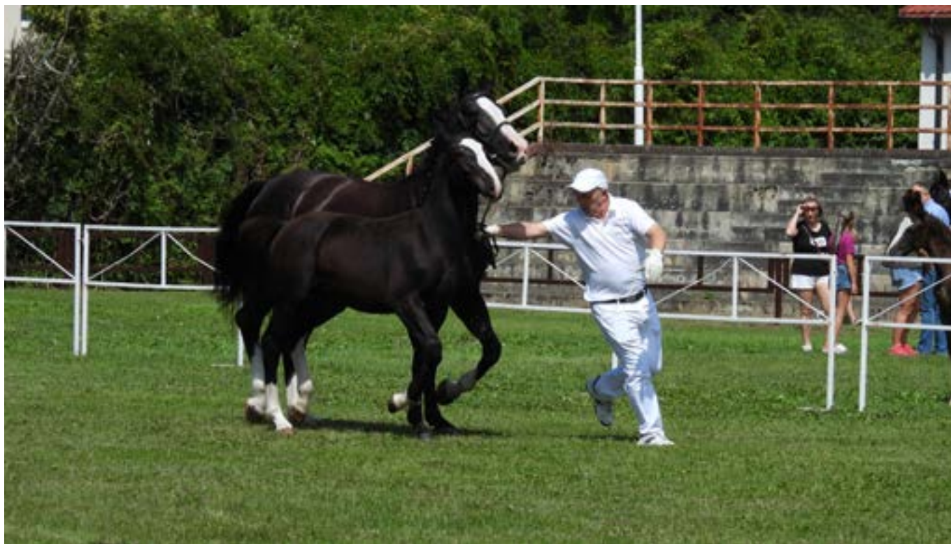
Konie: rasa śląska

Premiowanie jest również doskonałą okazją do zawierania umów sprzedaży. Dzięki prezentacji młodych sztuk zainteresowani kupnem mogą obejrzyć zwierzęta na żywo i wybrać najwyższej jakości okazy bezpośrednio od hodowcy. Wydarzenie umożliwia spotkanie w gronie branżowym, co w efekcie pomaga nawiązaniu kontaktów i relacji handlowych pomiędzy hodowcami, a ewentualnym kupcami.