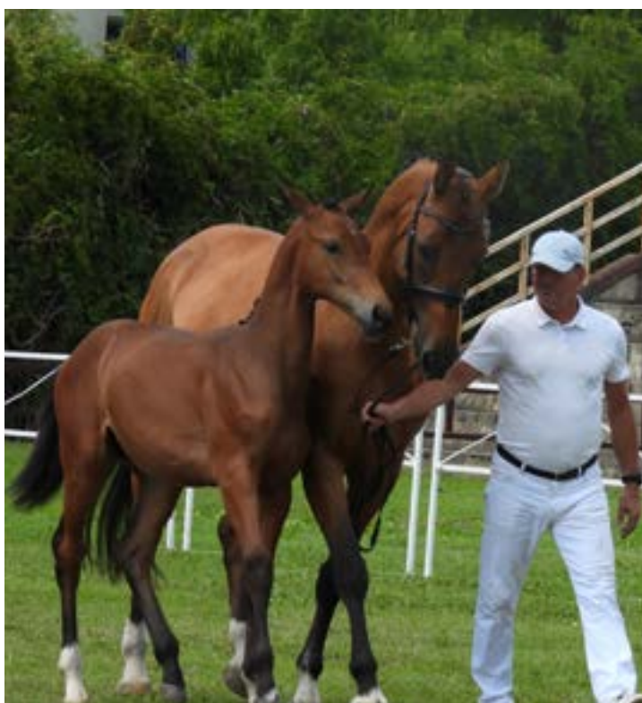
Konie: rasa wielkopolska

Premiowanie źrebiąt jest wydarzeniem promującym hodowlę koni ras wielkopolskiej, polski koń sportowy,